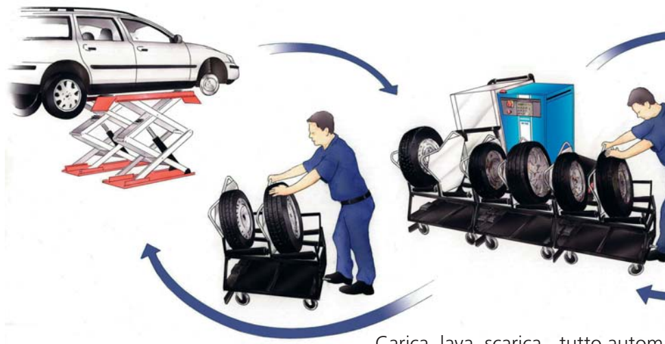
Carica, lava, scarica - tutto automatico